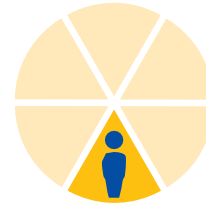
١ من ٦

المصابين بمرض السل النشط يذهبون الى المستشفى